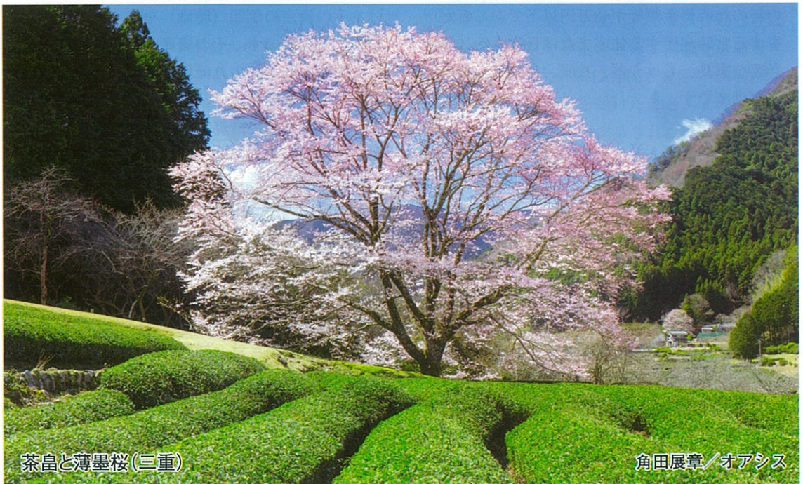
茶畑と薄墨桜(三重)