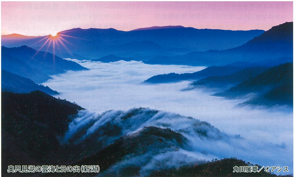
奥只見湖の雲海と目の出(新潟)