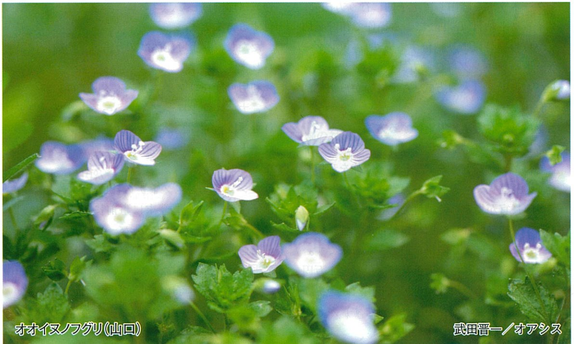
オオイヌノフグリ(山口)