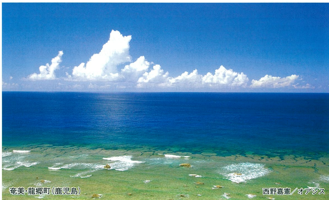
奄美・龍郷町(鹿児島)