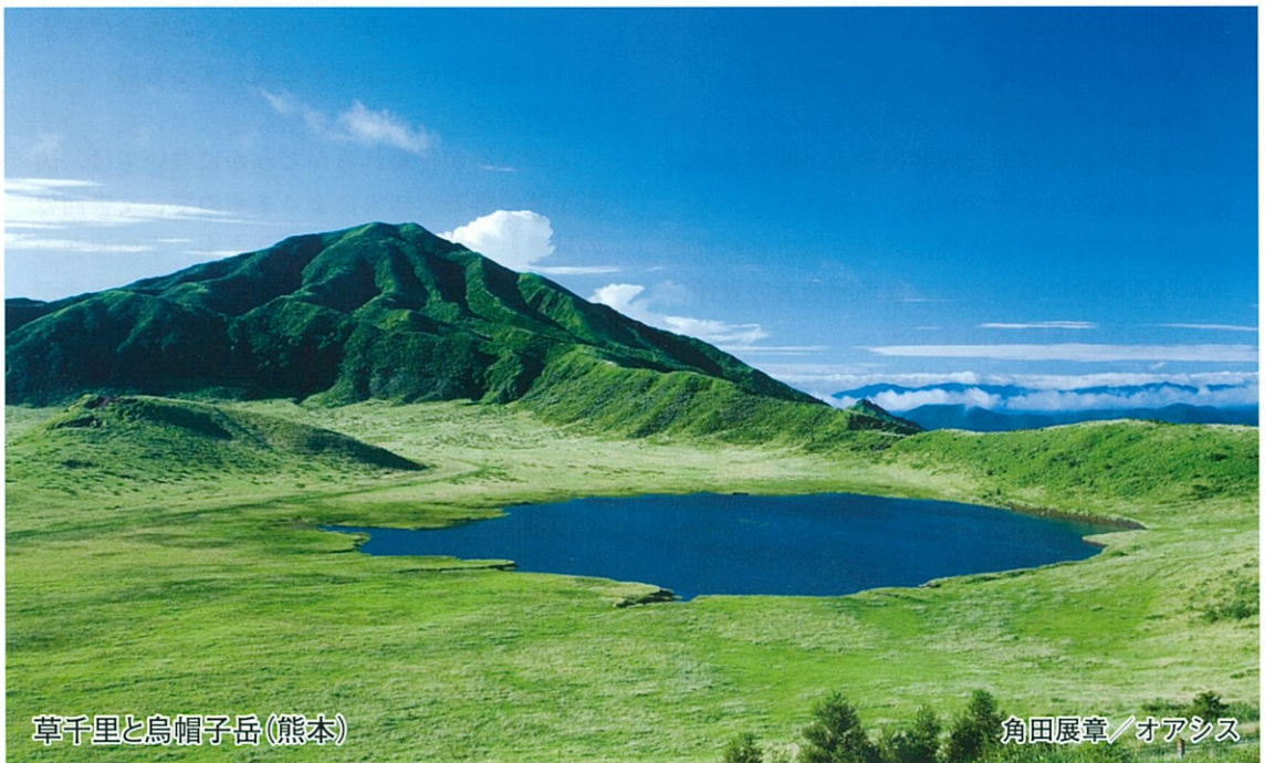
草千里と烏帽子岳(熊本)