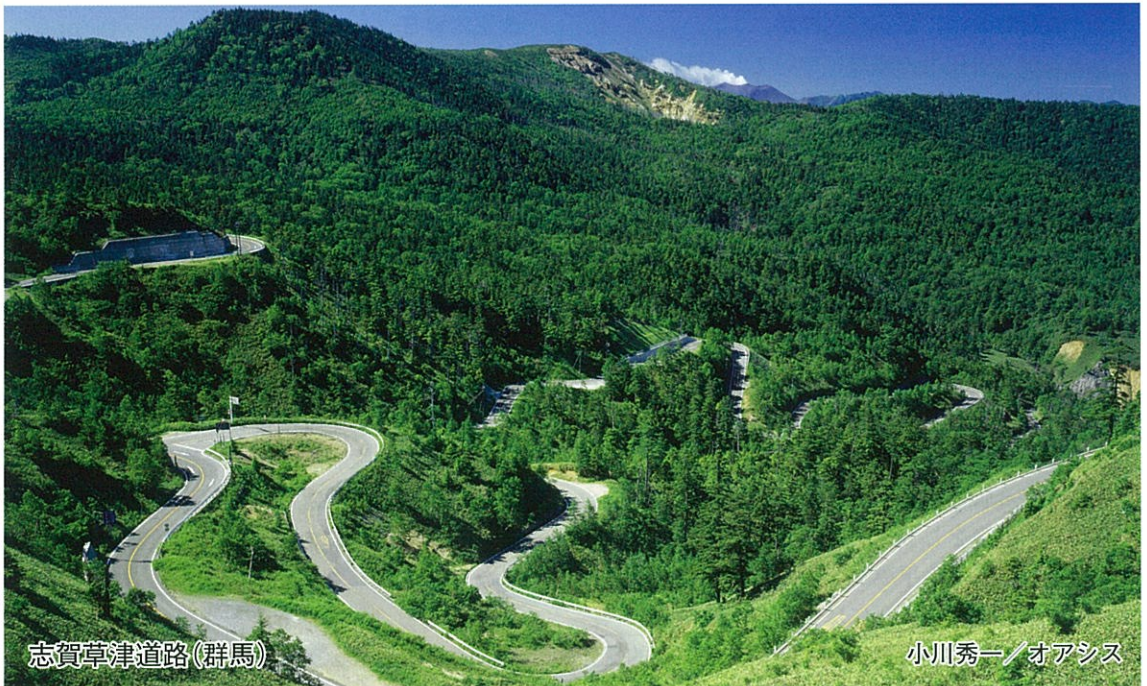
志賀草津道路(群馬)