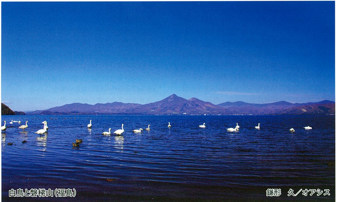
白鳥と磐梯山(福島)