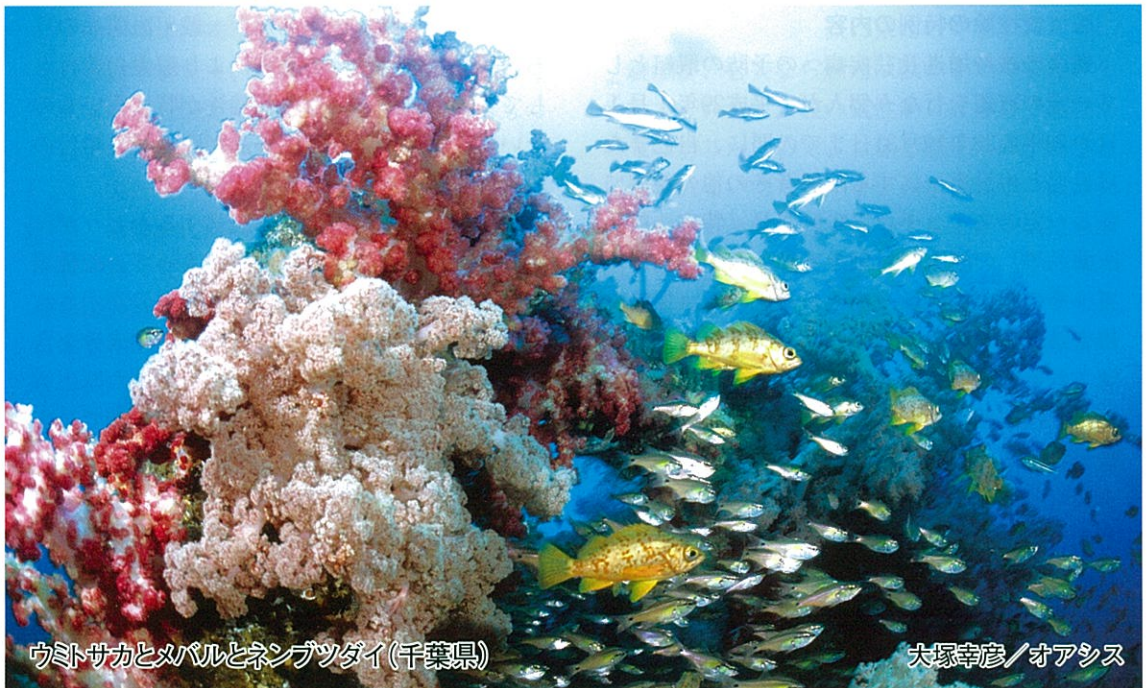
ウミトサカとムバルとネンブツダイ(千葉県)