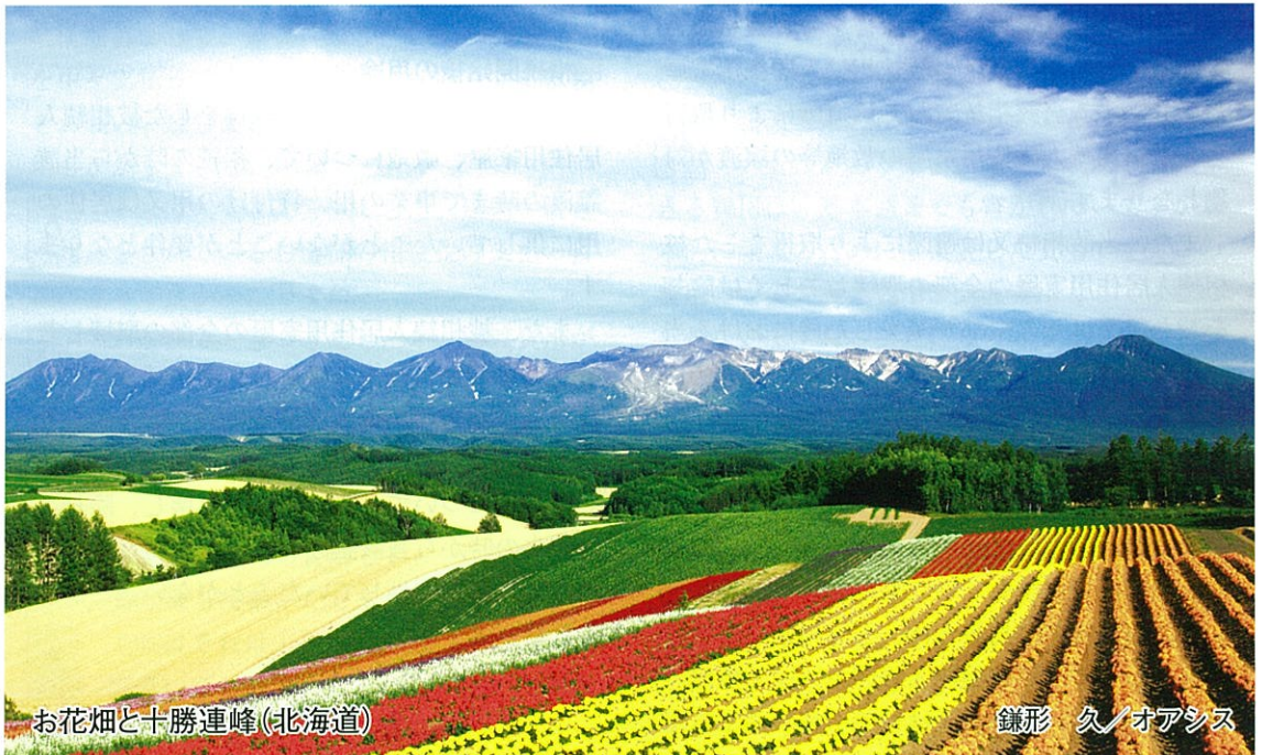
お花畑と十勝連峰(北海道)