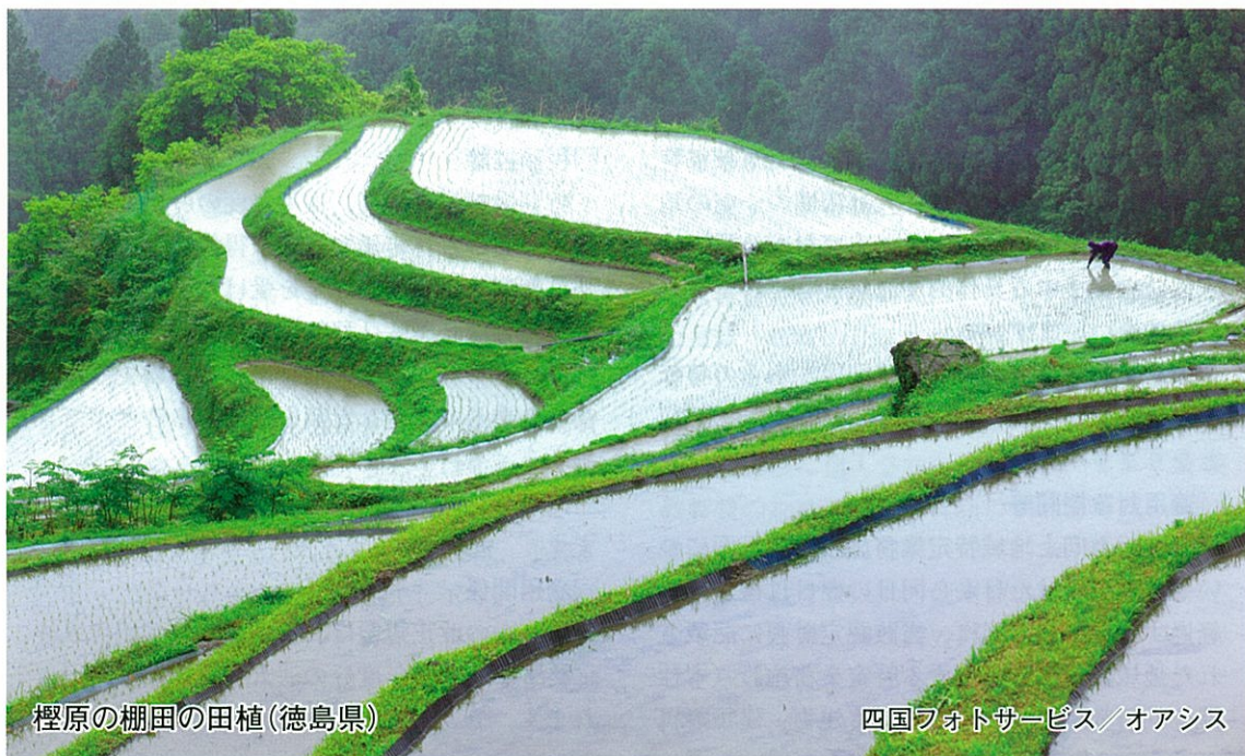
榎原の棚田の田植(徳島県)