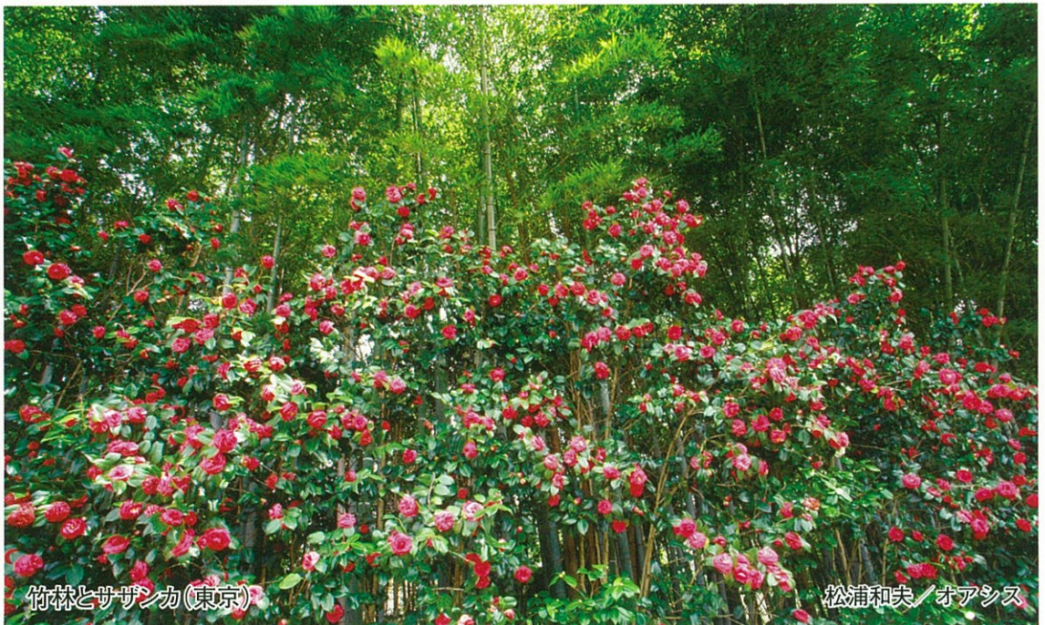
竹林とサザンカ(東京)