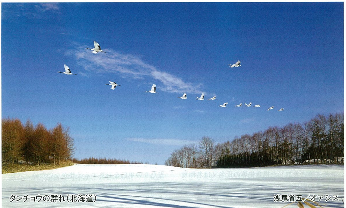
ダンチョウの群れ(北海道)